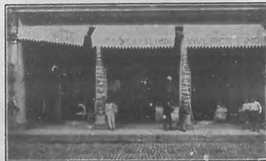
"Cuba Cataluña".—Fachada del acreditado establecimiento.

En Cienfuegos, y con motivo de inaugurarse la capilla del Sanatorio de la Colonia Española, uno de los mejores bajo todos conceptos que se levantan en Cuba, celebráronse lucidas fiestas de las cuales dan buena idea las fotografías que publicamos en esta página, debidas á nuestro amigo y colaborador artístico señor Alejandro J. Rossi. La colonia española puede estar orgullosa de contar con un Sanatorio de tanta importancia como el de Cienfuegos, que es modelo entre los similares.