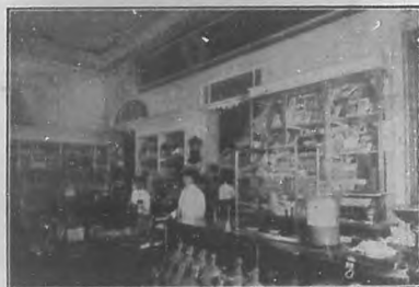
Departamento de dulcería, repostería y víveres finos.

A las repetidas pruebas de admiración que le hemos dado al ilustre escritor, va nuestro agradecimiento por la cortesía que ha tenido para con BOHEMIA.