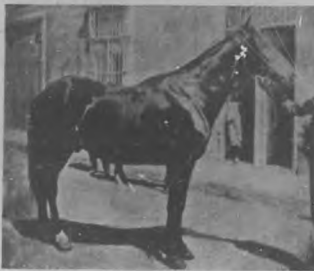
El caballo que en la guerra montaba el General Máximo Gómez.

Y algo más sintética el caballo. Algo, sinó de transcendencia, por lo menos de suave emotividad. El caballo es