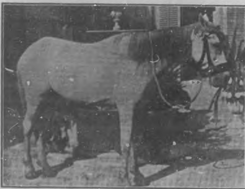
Caballo "Martinete", que montaba Antonio Maceo.