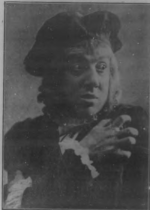
El notable actor Francisco Fuentes en "Hamlet".

De la compañía en general podemos decir, por lo poco que hemos visto, que es discreta en conjunto; que no presenta mal las obras; y que, de menudear estrenos, que tienen, entre otras, la ventaja de evitar comparaciones, hará buena campaña.