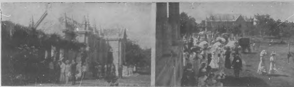
Desfile del público después de la inauguración.